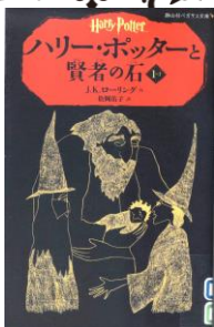
『ハリー・ポッターと賢者の石 1-1』 J.K.ローリング/作 松岡 佑子/訳 静山社

ファンタジーは子どもだけのものではない！大人も楽しめる骨太なファンタジーを紹介します。大人だからこそ判るファンタジーの奥深さを味わってみませんか。