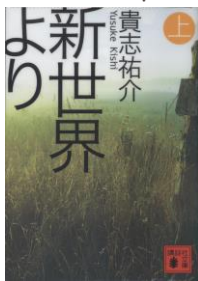
『新世界より 上』 貴志 祐介/著 講談社 (文庫版)