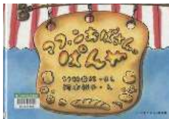
『マフィンおぼさんのぱんや』