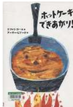
『ホットケーキできあがり!』