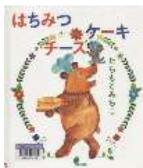
『はちみつチーズケーキ』