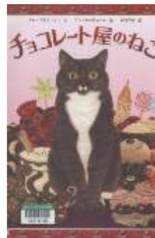
『チョコレート屋のねこ』

スー・ステイントン/文 アン・モーティマー/絵 中川 千尋/訳 ほるぷ出版 E-モ