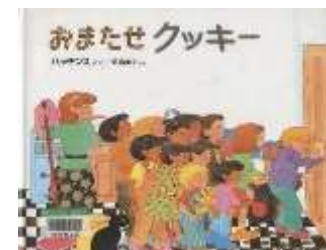
『おまたせクッキー』