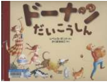
『ドーナツだいこうしん』