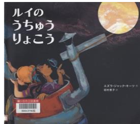
『ルイの うちゅう りょこう』